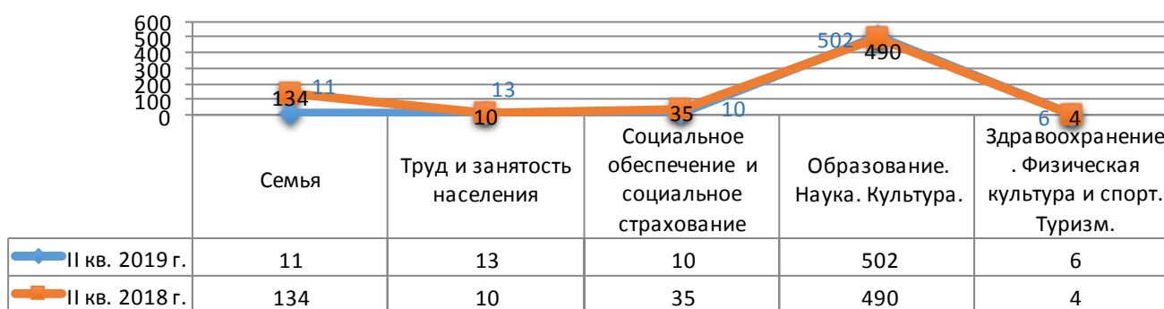
Количество обращений раздела 2 «Социальная сфера», поступивших во II квартале 2019 г. и во II квартале 201